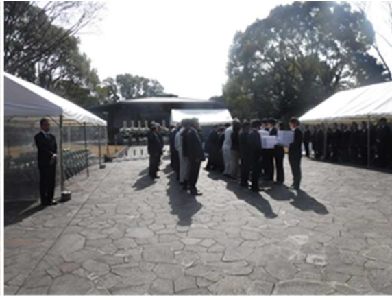
千鳥ヶ淵戦没者墓苑における戦没者遺骨引渡式