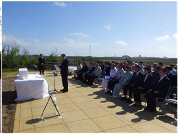
硫黄島(天山)における現地追悼式