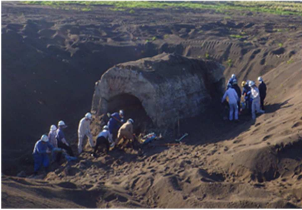
村重機班が発見したトーチカでのご遺骨の収集 (第4回収容派遣)