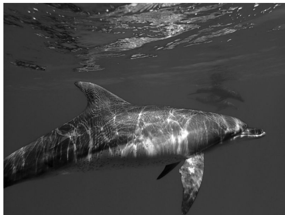
個体識別番号#19のミナミハンドウイルカ

19が、ハシナガイルカの子供と一緒に泳いでいたことが確認できています。 #19は2003年から毎年父島周辺で見られているメスのイルカで、右胸ビレの白斑が特徴です。2012年の8月には、初めて子供を出産しました。