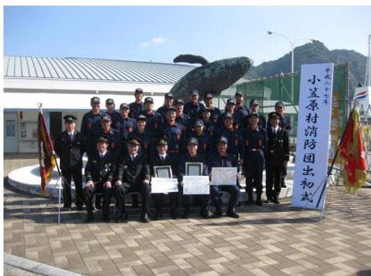
小笠原村消防団 母島分団