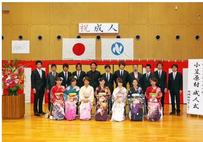
小笠原村 小笠原村教育委員会