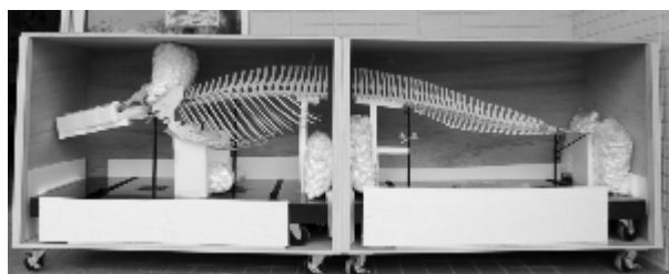
マダライルカの全身骨格

厳重に梱包された箱を開けると、そこには立派な姿になった標本がありました。組立前の骨格は損傷していた部位もありましたが、でき上がった標本を見ると、見事としか言いようがありません。