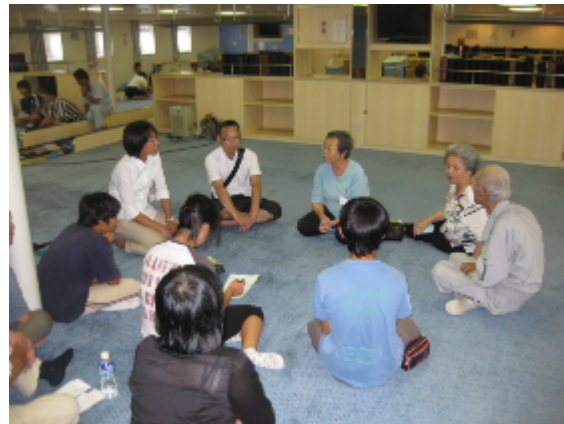
旧島民と中学生の交流会