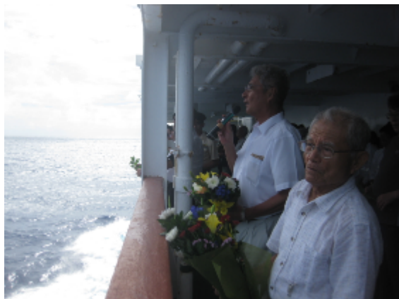
北硫黄島沖での洋上献花