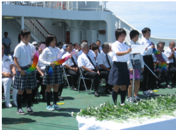
慰霊祭(中学生による誓いのことば)

旧島民29名、硫黄島協会8名、父母中学生(教員含む)34名、来賓および村役場職員32名 総勢103名