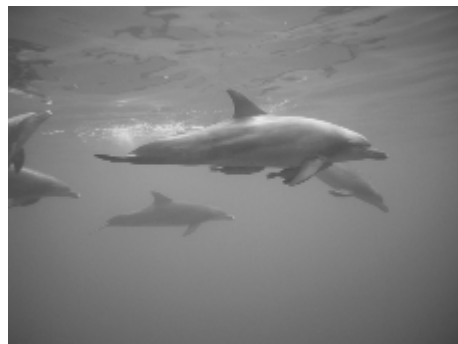
水中を泳ぐ ミナミハンドウイルカの群れ

ここ小笠原でもドルフィンスイムの最中に、ミナミハンドウイルカが海藻をヒレに引っかけたり、捕まえたと思われる餌をつついたり「モノ」を使った行動を見ることがあります。御蔵島のミナミハンドウイルカでは、ビニールやカップなどのゴミと思われる「モノ」で遊んでいた例も報告されています。