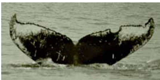
確認年 : 92,93,95,98,99,00,02,03,05,06 写真家の望月昭伸さん(愛称モッチ)が、生まれた年の写真を撮影されたことから命名。 93、普通なら母離れしているはずだが母子一緒に父島で確認。00、03、05に出産の記録あり。今年も2月に子連れで確認。