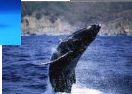
2005フォトコンテスト イルカ・クジラ部門賞 「大迫力」

小笠原諸島の自然・風俗をテーマに、今年もフォトコンテストを開催します。応募期間は7月からを予定していますが、写真の撮影日は問いません。入賞した作品は、ポスターなど観光PRに活用させていただきます。詳細につきましては、7月号の村民だよりでお知らせいたします。入賞を目指して、今からとっておきの小笠原を撮りためておきましょう。