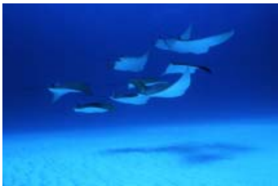
2005フォトコンテスト マリン部門 金賞 「ウシバナトビエイの舞」