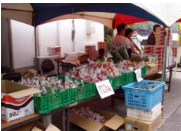
昨年の母島フェスティバル風景。野菜詰め合わせパック(150円)やパッションフルーツなどに加え、パチマグロをサクで販売しました。また、漁協から亀の煮込みが試食として振舞われました。