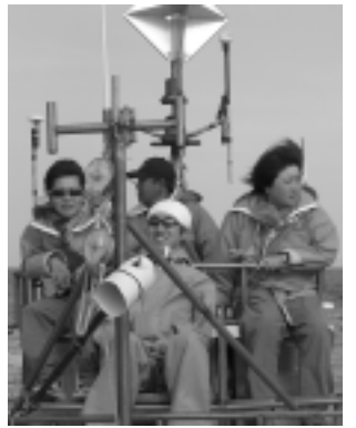
この道 50 年の海人(うみんちゅ)の操船で、海域間を移動中。

沖縄美ら海水族館は、3 年目をむかえる北太平洋ザトウクジラ国際共同研究「SP L A S H」の一員です。この沖縄の調査には、2004 年、2005 年シーズンに海洋センターで経験をつんだ 4 名の元ボランティアの皆さんが参加し、成果をあげています。沖縄のクジラシーズンは小笠原に比べて短く、3 月いっぱいと言われており、余すところ 1 か月、皆さんの活躍に期待しています。