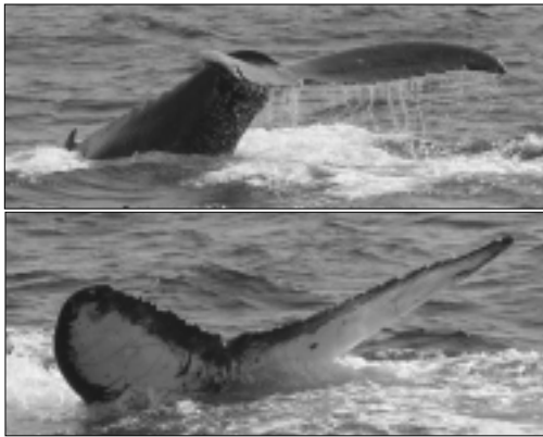
背びれ前部が歪で、背びれから尾びれが曲がらないクジラ「イビ」( )。小笠原では、93,96,97,98,02,05 年に確認。沖縄では今年初確認。

今回、沖縄で再会した小笠原のクジラは、背びれ前部が歪(いびつ)なため、とっさに「イビ」と呼んでからもう 13 年が経ちます。今まで、同シーズン内に、小笠原と沖縄を行き来しているクジラもいますので、この「イビ」も今シーズン小笠原で再会できるかもしれません。お見かけの際は、ぜひ一報ください。