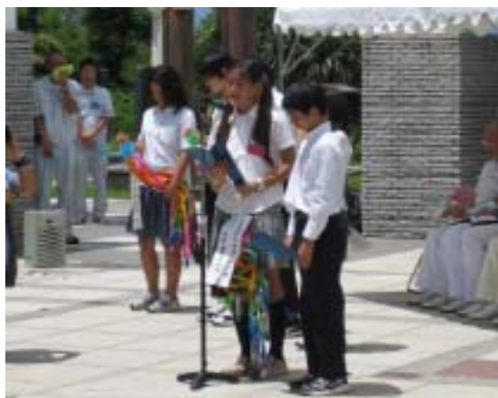
中学2年生による“誓いの言葉”

第9回硫黄島訪島事業を6月16日から19日にかけて実施しました。今年、天候にも恵まれ17日、18日の2日間とも予定通りに上陸することができました。