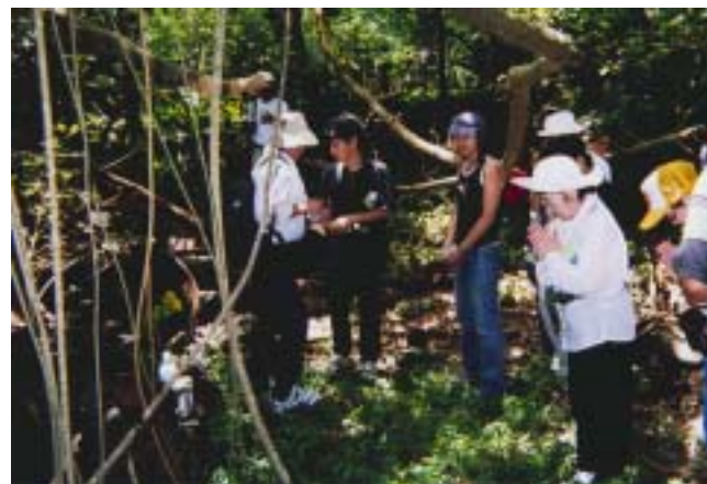
多くの旧島民の方々が命を落とした204設営隊(釜場)

村としては今後とも、旧島民の心情に報いるための訪島事業を行うと共に、遺骨収集に積極的に協力してまいります。