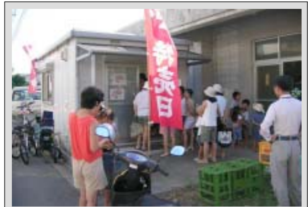
【当日は、大勢のお客様で賑わいました】

「地産地消推進会議」は小笠原島漁業協同組合、東京島しょ農業協同組合小笠原父島支店、小笠原村商工会、小笠原村観光協会、村役場で組織しています。