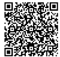
不在者投票宣誓書(兼請求書)

*郵便(投票済み投票用紙)が2月7日(土)東京発のおがさわら丸に間に合う必要があります