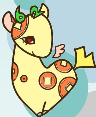
個人住民税PRキャラクター 「ぜいきりん」