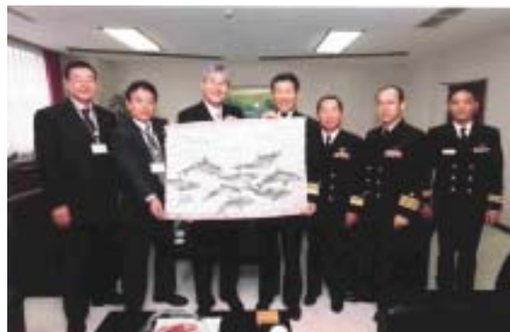
感謝状・記念品贈呈記念 平成15年11月6日

11月6日、村長、議長および総務文教委員長が海上自衛隊厚木基地を訪ね、航空集団司令および第4航空群司令に感謝状と記念品を贈呈しました。