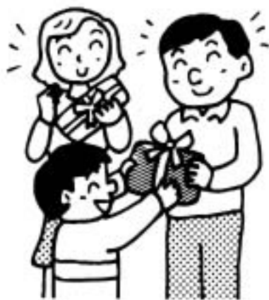
勤労感謝の日 (11 月 23 日)