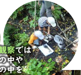
昆虫観察では土の中や沢の中を大捜索!