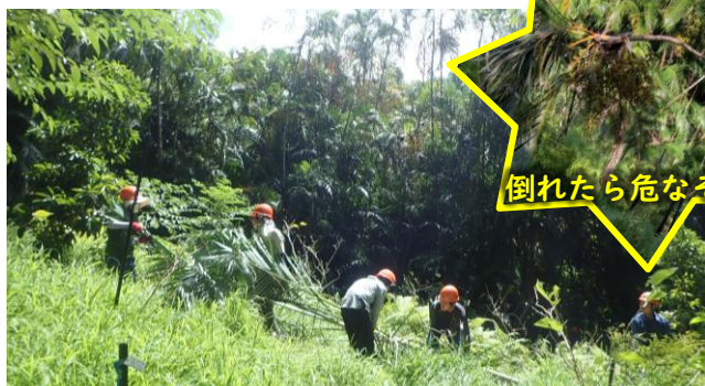
倒れたら危なそう...

ヤシは思った以上に高く重く、ヒヤッとする場面もありましたが、無事に作業を終え、おかげでスッキリしました。