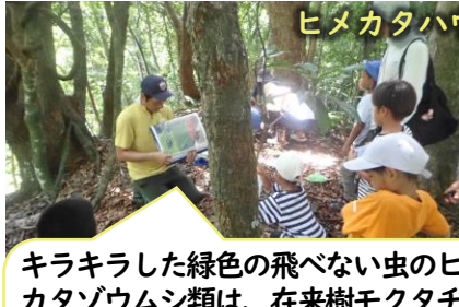
ヒメカタハウスで解説中

キラキラした緑色の飛べない虫のヒメカタゾウムシ類は、在来樹モクダチバナや外来樹キバンジロウの葉を食べます。ひょんなところが生息地になっていて、じつはオガモリにもいます。