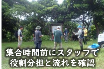
集合時間前にスタッフで役割分担と流れを確認

父島はグリーンアノール等の影響で虫はほとんど見られないんじゃないか…なんて思われていますが、実は意外にいるんです。そんな父島の虫事情を知ってもらうため、昆虫観察会を開催しました。今回は、野生研とおが高、そして講師の自然研とBOISSの皆さんと一緒に参加者・スタッフ計44名で行いました。