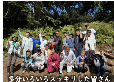
多分いろいろスッキリした皆さん