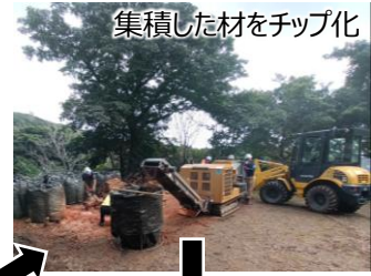
集積した材をチップ化