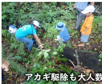
アカギ駆除も大人数でやればあっという間