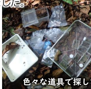
色々な道具で探してきた虫を観察&解説中