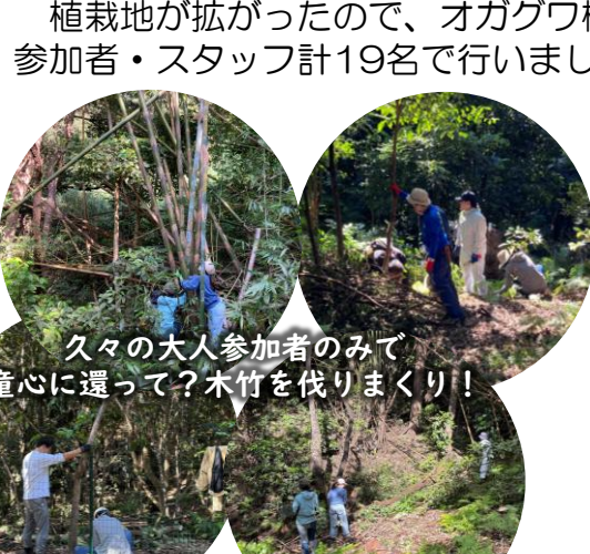
久々の大人参加者のみで童心に還って？木竹を伐りまくり！