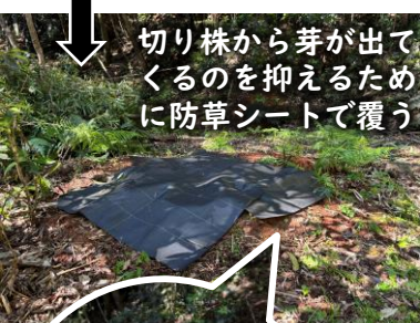
切り株から芽が出てくるのを抑えるために防草シートで覆う