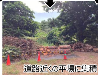
道路近くの平場に集積