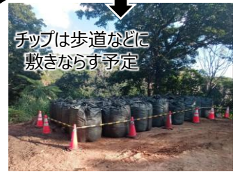
チップは歩道などに敷きならす予定