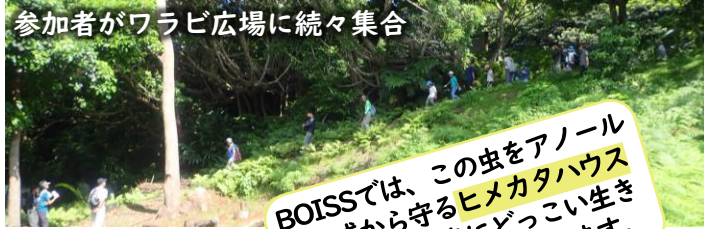
参加者がワラビ広場に続々集合