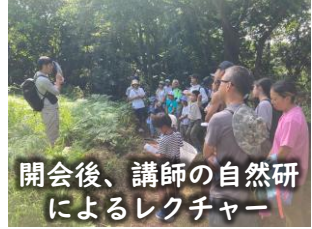
開会后、講師の自然研によるレクチャー