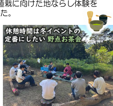
休憩時間は冬イベントの定番にしたい野点お茶会