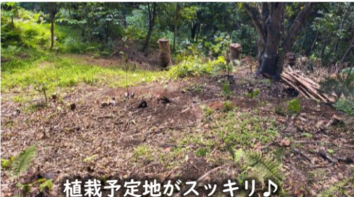
植栽予定地がスッキリ♪