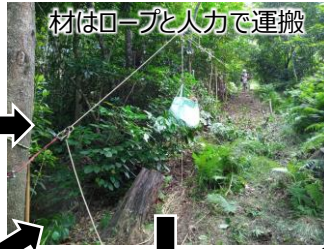
材はロープと人力で運搬