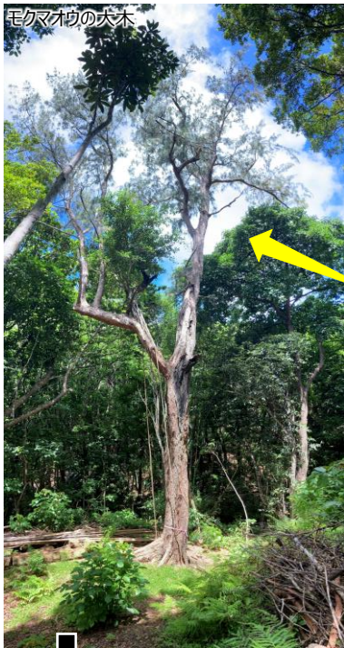
モクマオウの大木

父島の清瀬圃場にはオガグワ苗が70本ほどあります。この苗用の植栽地をつくるため、大きなモクマオウ・アカギを計4本伐採し、残置されていた木材を片付け、ヤギ侵入防止柵を拡張し、新たに出来た入り口までの歩道を整備しました。