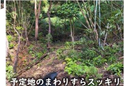
予定地のまわりすらスッキリ