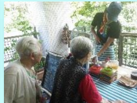
島っ子のカキ氷屋さん の出張サービス！