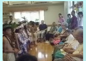
子供たちとの交流イベント 島伝統のおどりの披露です