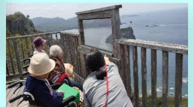
天気の良いときはドライブ♪♪