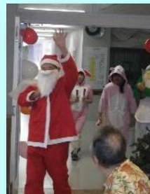
南の島にもクリスマス