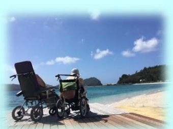
海を眺めるひととき