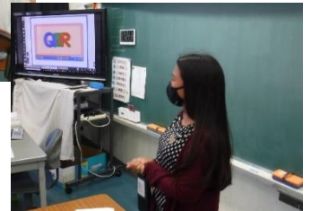
1～6年 「外国語・外国語活動」