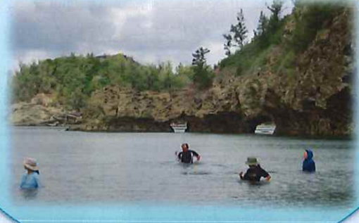
海の中でウォーキング♪