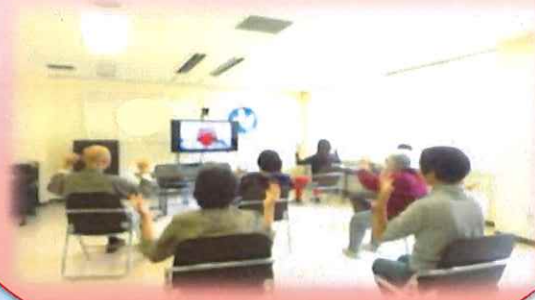
介護予防体操教室