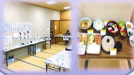
健康診断 結果説明会