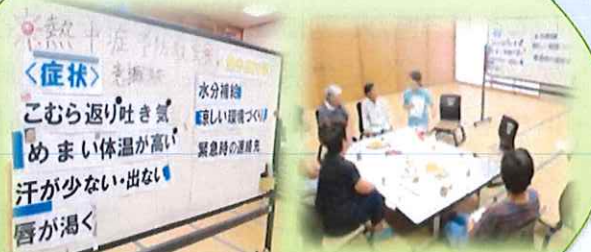
高齢者熱中症予防教室