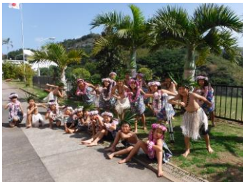
3年「南洋踊りの学習」

南洋踊りや小笠原太鼓をはじめとした小笠原の伝統・文化を学ぶ授業、アオウミガメをはじめとした固有種や希少種を教材とした授業などの『 小笠原学習 』を通して、豊かな心を育成します。