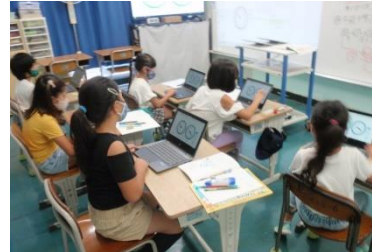
3～6年 「算数少数数学習」 1～6年 「一人一台のパソコン活用」

島ならではの感性を生かして、どこにでも通用する学力を身に付けさせるために、 小・中学校9年間の系統的な学びを推進し、『わかる』から『できる』授業の実現を目指します。