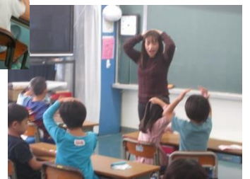
1～6年 「外国語・外国語活動」