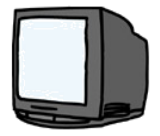
液晶テレビ・ ブラウン管テレ